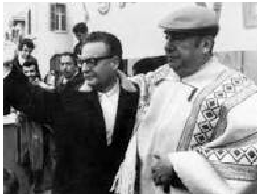
Pablo Neruda et Salvador Allende.